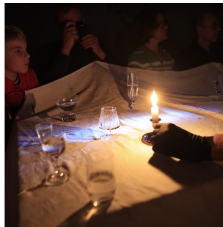
Návštěva u malé smrti

Dnes nezahájíme divadelní smršť zahájením přehlídky, nýbrž rovnou Malou smrtí . V 16:40 nezačneme na zemském povrchu, nýbrž pod ním, v orchestřišti Šrámkova divadla. A v celém dvoudenním programu se Malá smrt od heřmanické skupiny ANSUV vyskytuje sedmkrát. Není to tisková chyba, bude to prostě tak. Smrt je stejně důležitá jako život, a když bude malá, předpokládám, že bude i hezká, křehká, zranitelná, prostě sympatická. Lidé ze souboru nám vzkázali, že smrt je všude doma, že se stěhuje od Chocně, přes Hradec Králové, Heřmanice nad Labem až do Strakonice.